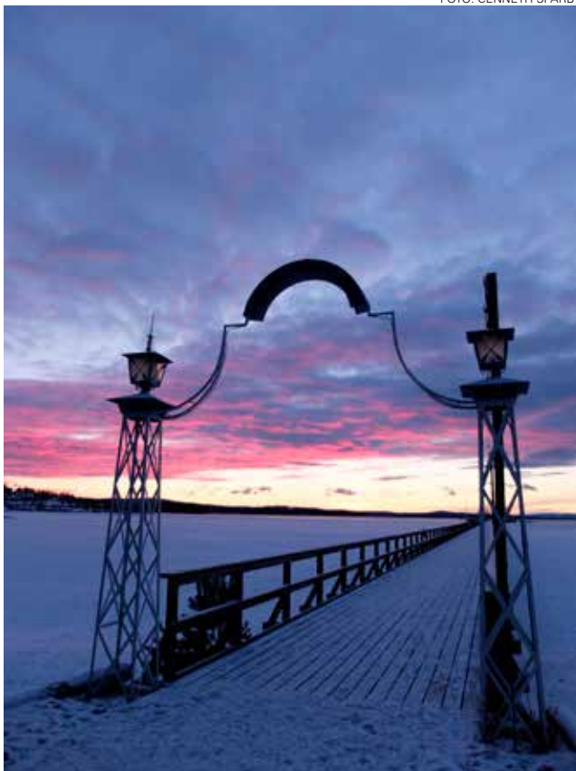
Bli nostalgisk på Diner 45 i Rättvik. Långbryggan i Rättvik – en klassiker.

let och njut en stund. Passar bra på orten, med tanke på populära Classic Car Week, som arrangeras varje sommar.