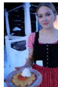
Gammalgårdens väfflor – en höjdare i sig.