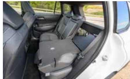
BYGGT FÖR TRE. Baksätet är fällbart med delning 60/40 och benutrymmet är ganska bra bak. Tre åker bekvämt och det finns ryms bagage bakom dem.