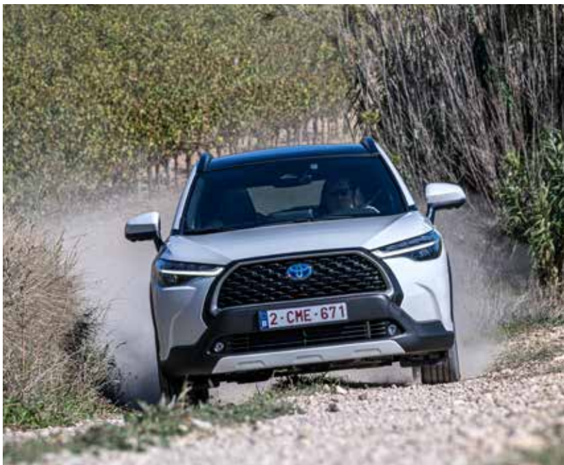
VALT EGEN VÄG. Toyota har valt en egen linje när det gäller fyrhjulsdriivningen i Corolla Cross. Här drivs bakaxeln enbart av en svagare elmotor med uppgift att stabilisera bilen och ge bättre framkomlighet. Det fungerar utmärkt på exempelvis grusvägar.