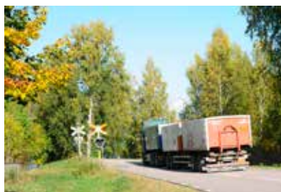
Riktigt hård inbromsning.