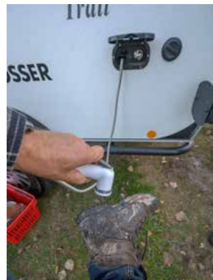
DUSCH PÅ UTSIDAN. Det finns även en utomhusdusch för leriga skor eller en varm kropp efter en dags arbete i skogen.