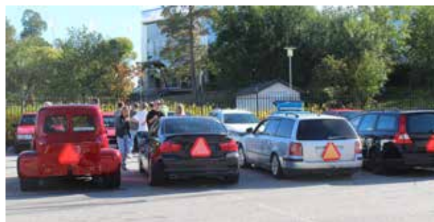
POPULÄR TRAKTOR. Många ungdomar kom för att visa upp sina A-traktorer när Strängnäs kommun arrangerade träff.

– Syftet med ett sådant här engagemang är att locka hit ungdomar och få dem att