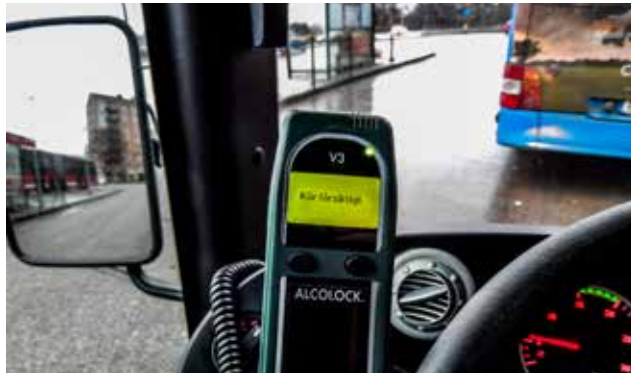
ALKOLÅS. I dag finns det ungefär 350 000 alkohol i Sverige. MHF vill få fler kommuner att ställa krav på alkohol eller liknande stödsystem vid upphandling av transporter.

– Jag tror att Joe Biden och Demokrater-