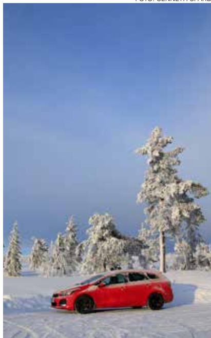
Vid vägens slut tar skidspåren vid.