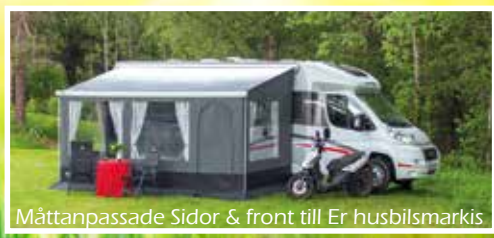
Måttanpassade Sidor & front till Er husbilsmarkis

Svenska Tält i Dorotea AB Timmervägen 5 917 32 Dorotea 0942-10815 info@svenskatalt.se www.svenskatalt.se