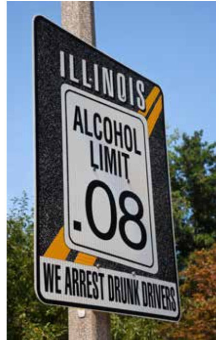
PROMILLEGRÄNS. 30 procent av alla som omkom i vägtrafiken i USA 2020 gjorde det i en alkohol- eller drogrelaterad olycka.

”Alkolås räddar liv varje dag i Sverige och i världen.”