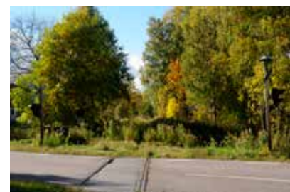
I själva verket: Knappast risk för tåg.