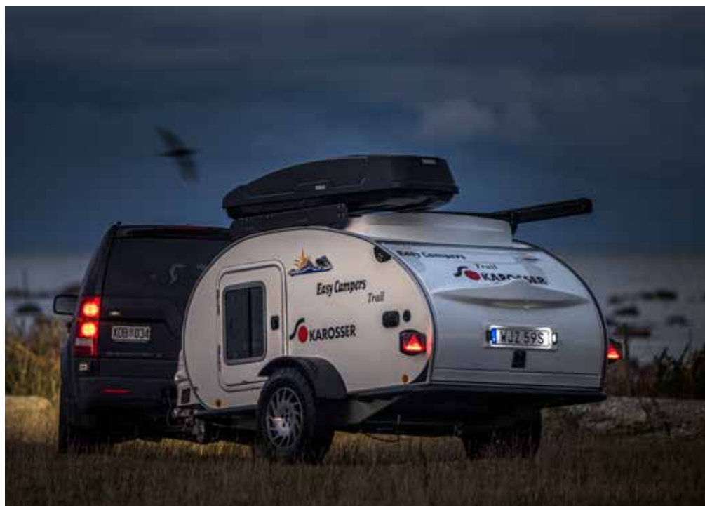
ROBUST. Hösten är fågelsträckens tid och S-karossers lilla robusta husvagn tar du med dig ända ut i kustbandet för att njuta de stora gåsflockarna under fullmånen.