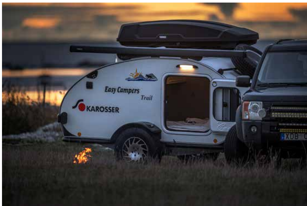
NATUREN SOM VARDAGSRUM. En modern lägerplats med nära till naturen. Med Easy Camper är naturen ditt vardagsrum. Här njuter man naturen tills det är dags att krypa in i den kompakta husvagnen