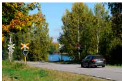
Ner i fart.