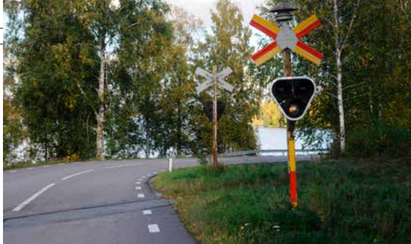
Varning: Här kan det komma tåg!