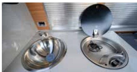
SPIS OCH BALJA. Spartanskt men väl fungerande kök med enlågig gasspis och diskbalja.