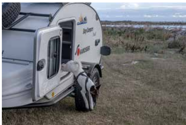
HUNDVÄNLIG. Foxterriern Tindra passar på att ge sig iväg ut på egna äventyr när dörren öppnas