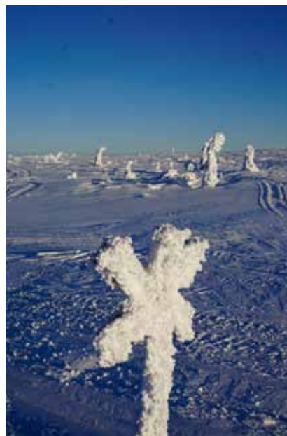
Ett levande konstverk i midvintertid.