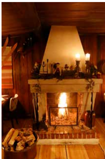
Stugmys på Gammelgården.

att njuta av de få timmar solen är uppe så här i början av året, och står länge och spårnar solnedgången från toppen av Sälkfället.