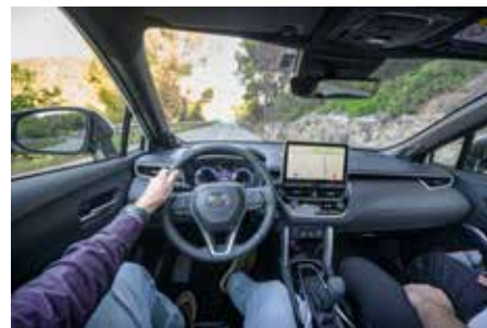
BRA DESIGN. Modern teknik med två digitala displayer. 10,5" för infotainment i mitten och en riktigt bra 12,3" display för instrumenthuset med lättläst och bra design av klassiskt snitt.