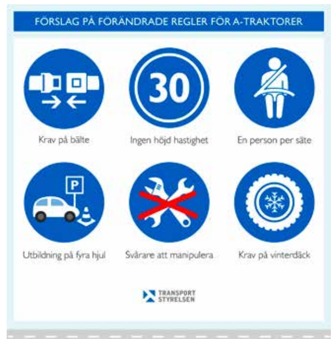
NYA KRAV. Här är en sammanfattning av den nya regler som Transportstyrelsen för A-traktorer som ska öka trafiksäkerheten.