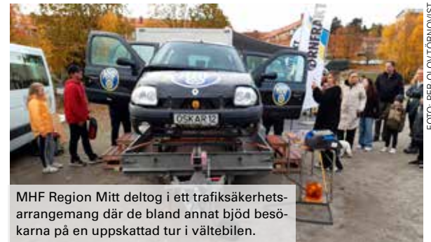
MHF Region Mitt deltog i ett trafiksäkerhetsarrangemang där de bland annat bjöd besökarna på en uppskattad tur i vältebilen.

MHF visade upp pedagogiska bordet Uppvaknandet, som lockade intresse hos ett större