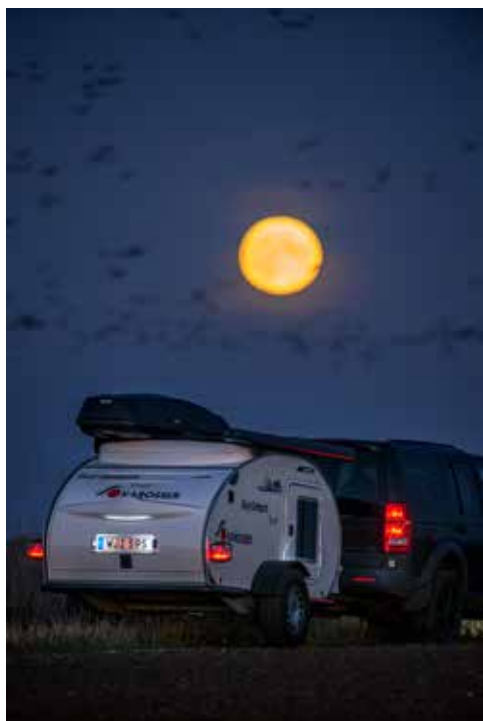
TÄLIG. Vagnen följer med även på ojämnt underlag och dess undersida skyddas av en kraftig rörram.