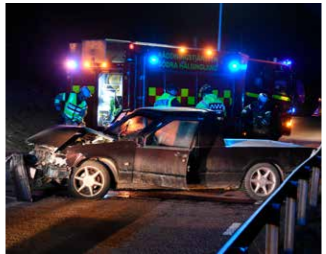
OLYCKSDRABBAT FORDON. Antalet A-traktorer har dubblats efter en regeländring för två år sedan. Under samma period har olyckorna tredubblats. Nu föreslår Transportstyrelsen nya regler som ska öka trafiksäkerheten.