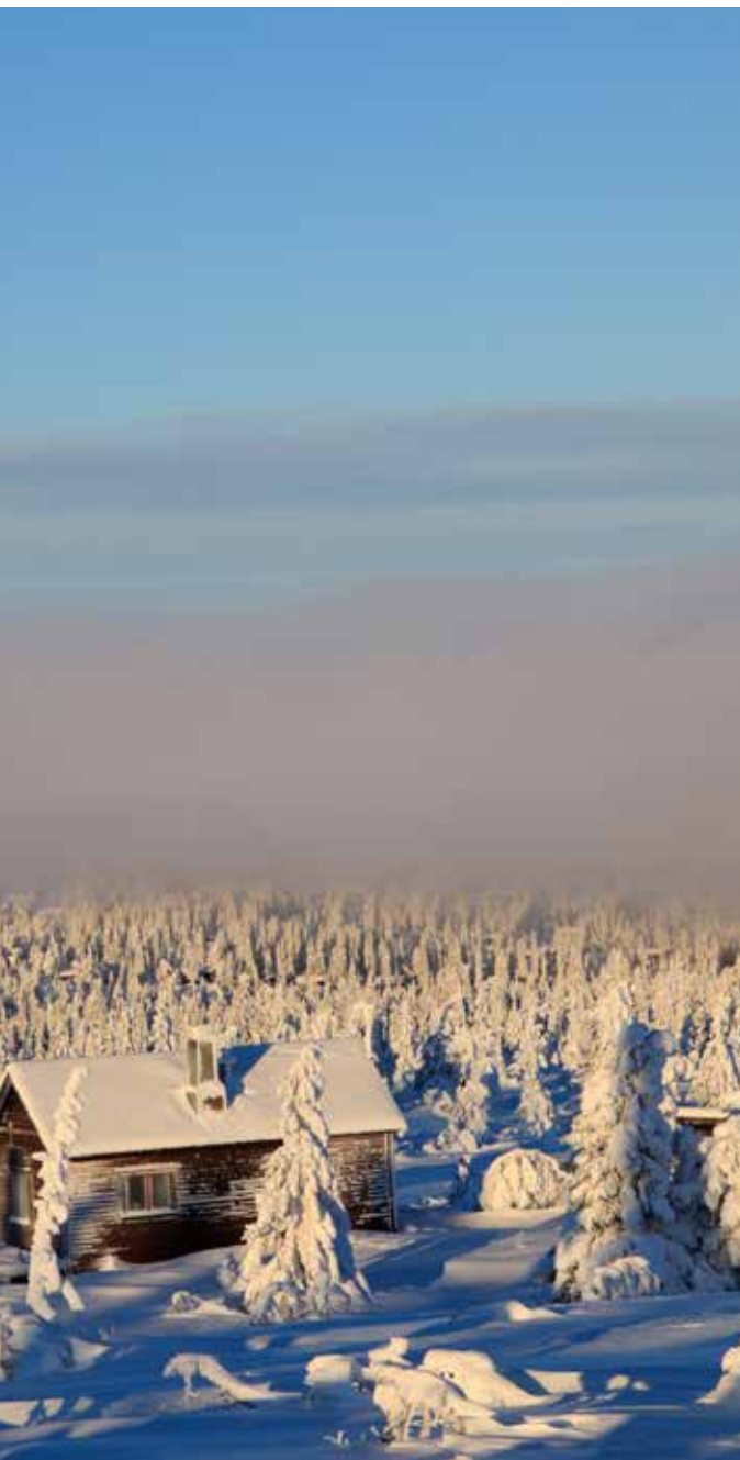
Minus 15 grader.