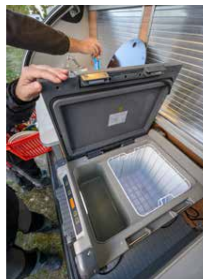
KYL OCH FRYS. Vagnen har ett eget kompakt kylskåp med frysfack.