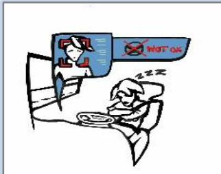
ATTENTIVE LONG HAUL TRUCKING