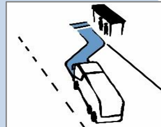
PASSENGER PICK UP/DROP OFF AUTOMATION FOR BUSES