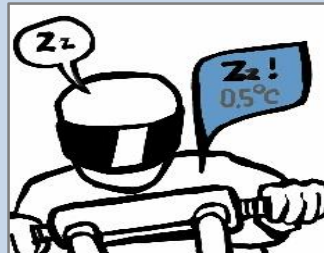
LONG RANGE ATTENTIVE TOURING WITH MOTORBIKE