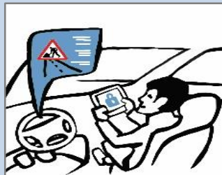
DRIVER STATE-BASED SMOOTH & SAFE AUTOMATION TRANSITIONS (CAR)