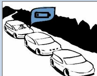
ELECTRIC VEHICLE RANGE ANXIETY